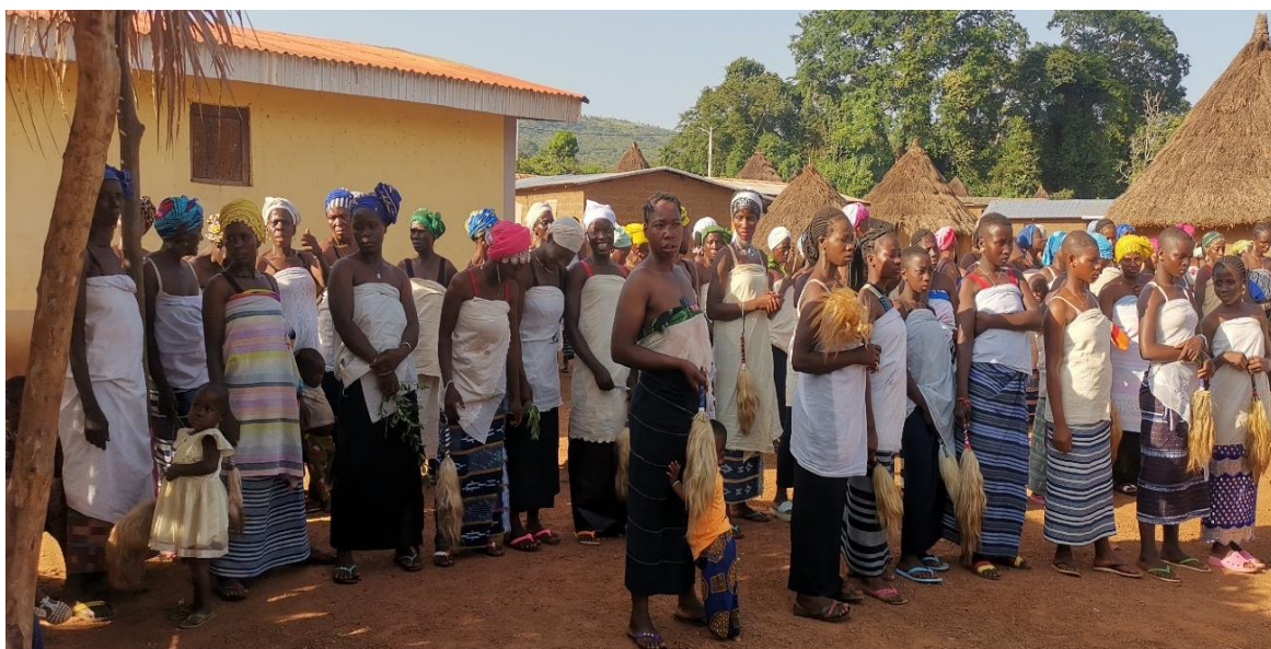
DANZA GUEGBLIN / GUEGBRIN ("de las aves zancudas")

Junto a ellas se conservan las máscaras en miniatura de carácter personal, Mago , que representan los espíritus tutelares para proteger a su dueño y ser tratadas como objetos sagrados.