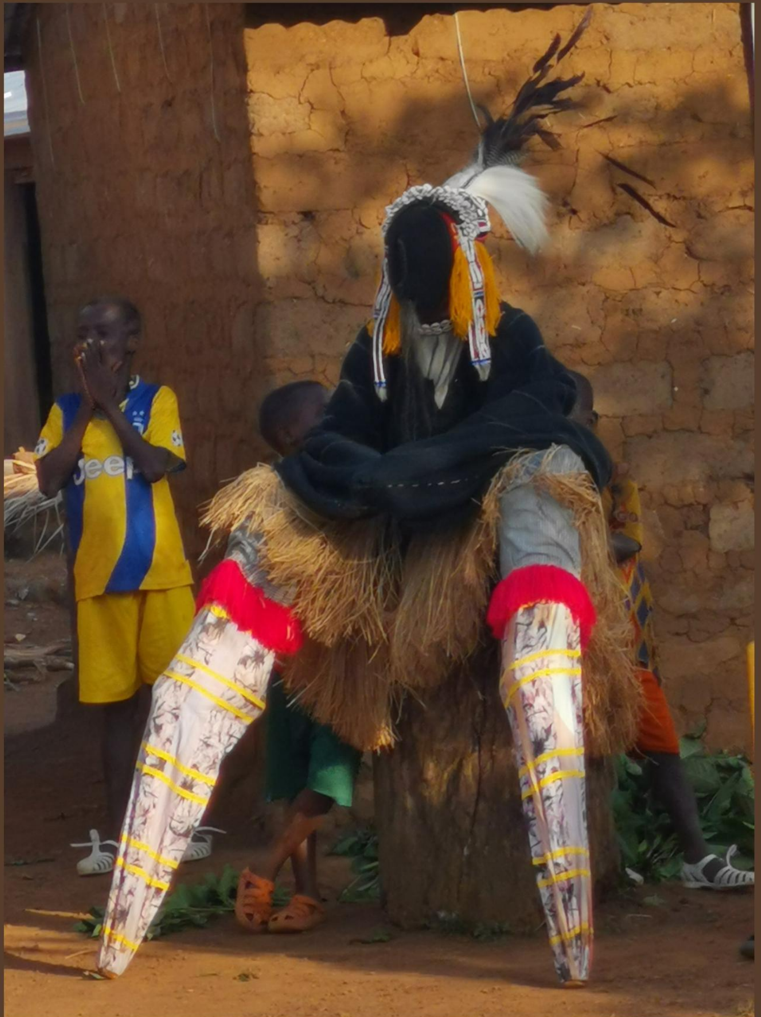
EL AVE ZANCUDA-DANZA GUEGBLIN / GUEGBRIN ("de las aves zancudas")