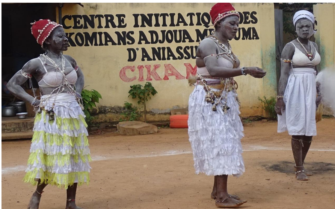
RITUAL DE LAS KOMIAN

Decíamos que el futuro de los Komian no se presenta muy halagüeño: los prejuicios científicos, el Islam y el cristianismo, junto con el fanatismo de algunos predicadores que les acusan de adorar al diablo, están exterminando esta tradición.