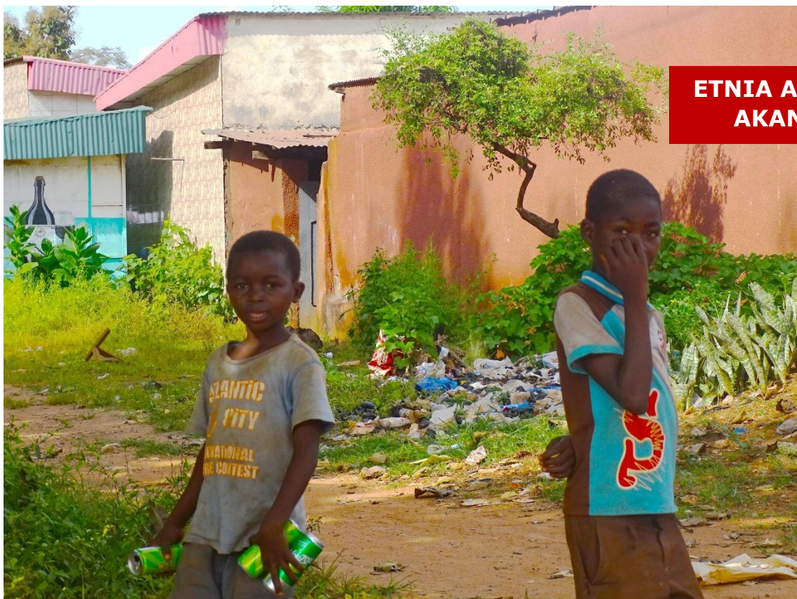
ETNIA ANYI AKAN

Los Akan practicaban la esclavitud , esclavos que utilizaban para labores domésticas, agrícolas y para la venta. Dada su necesidad, transformaban en esclavos a los prisioneros de guerra, los criminales, opositores a los jefes locales y muchos líderes rituales locales.