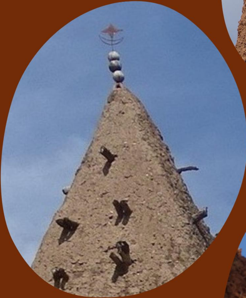
MEZQUITA PEQUEÑA DE KONG