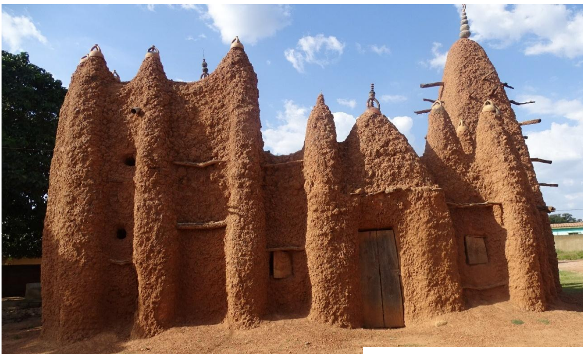
MEZQUITA DE KOUTO

Todas estas mezquitas del norte de Costa de Marfil son parecidas, pero con algunos aspectos distintivos (la cercana de Tengiela , por ejemplo, carece de contrafuertes), en este caso el elemento diferenciador son los remates de los pináculos: cascos de barro con tres cuernos cuyas puntas se tocan, y el Yumur o remate del Minarete que cuenta con cinco bolas decrecientes y una media luna, esto le distingue de la mezquita pequeña de Kong que tiene tres, mientras la grande tiene solo dos.