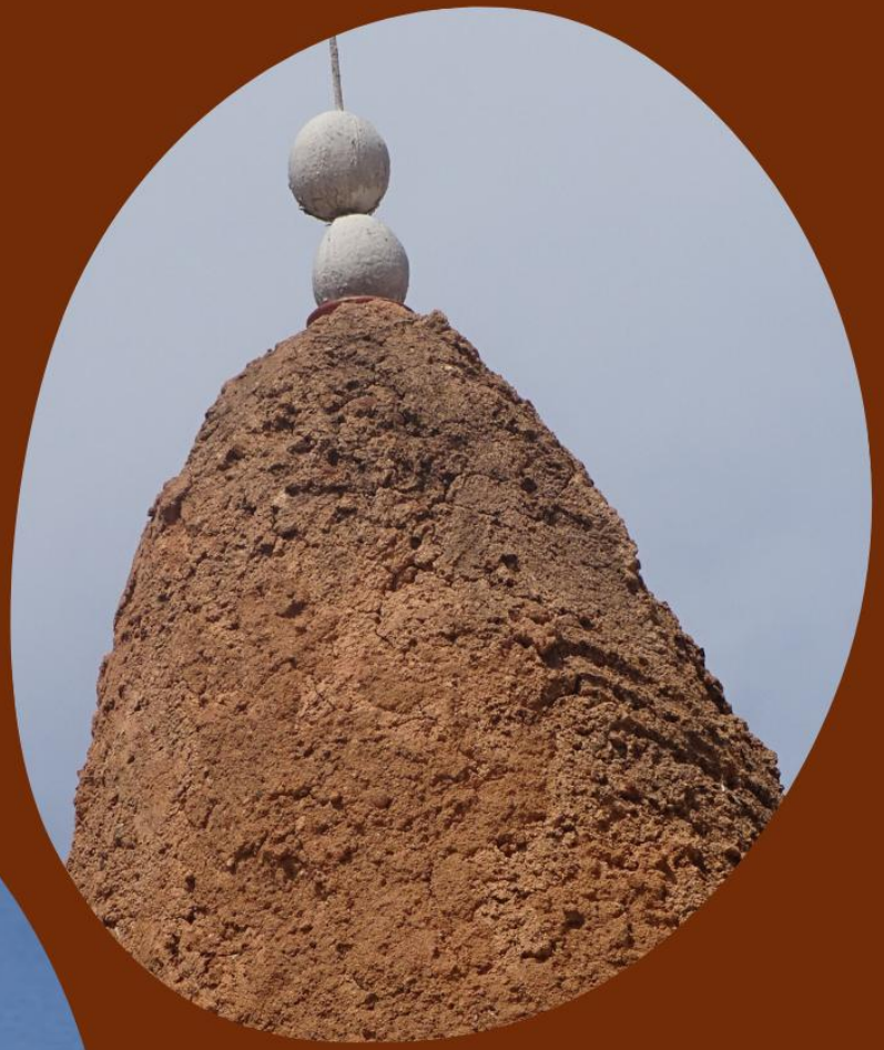
GRAN MEZQUITA DE KONG