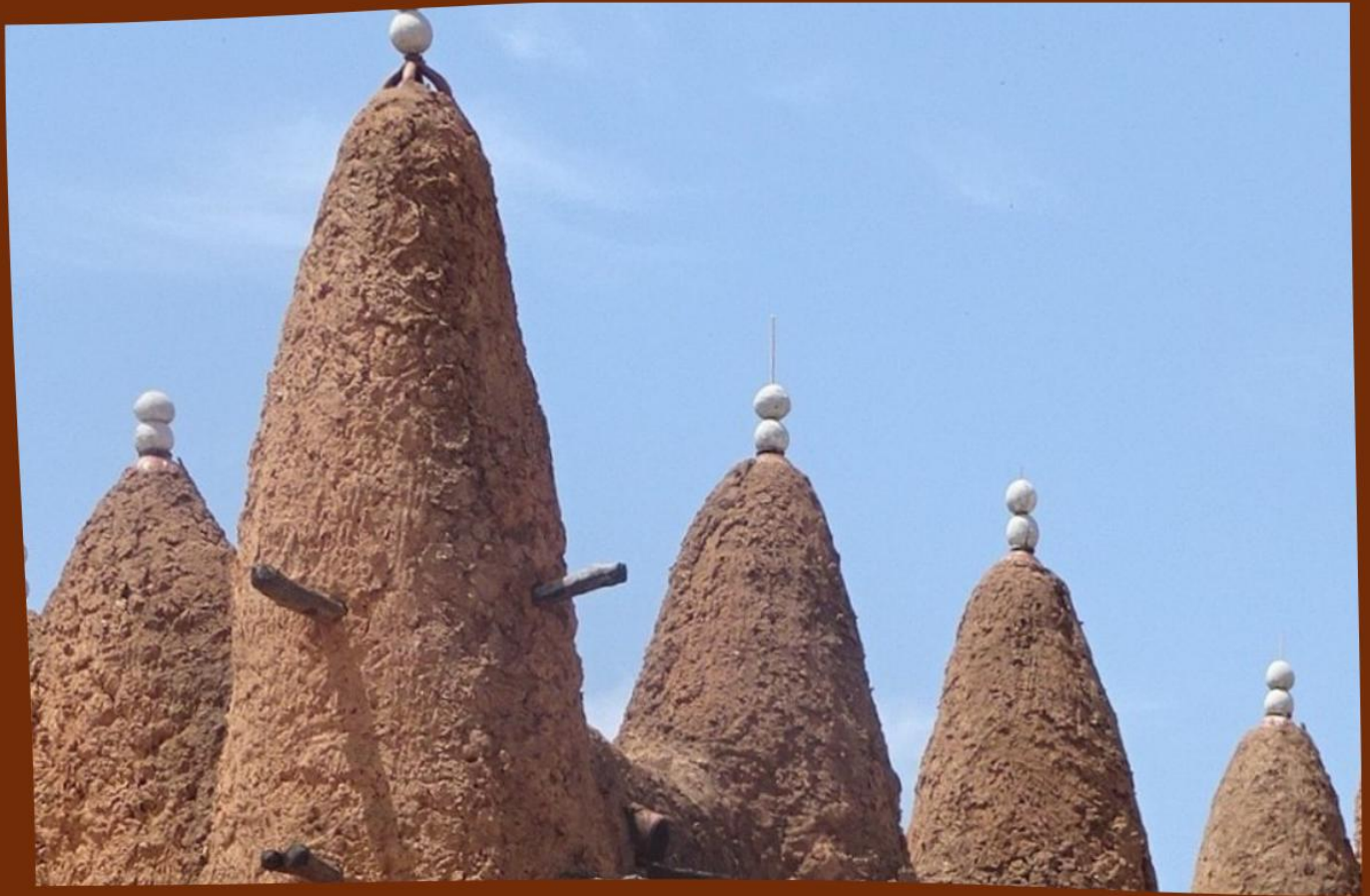
MEZQUITA DE KONG