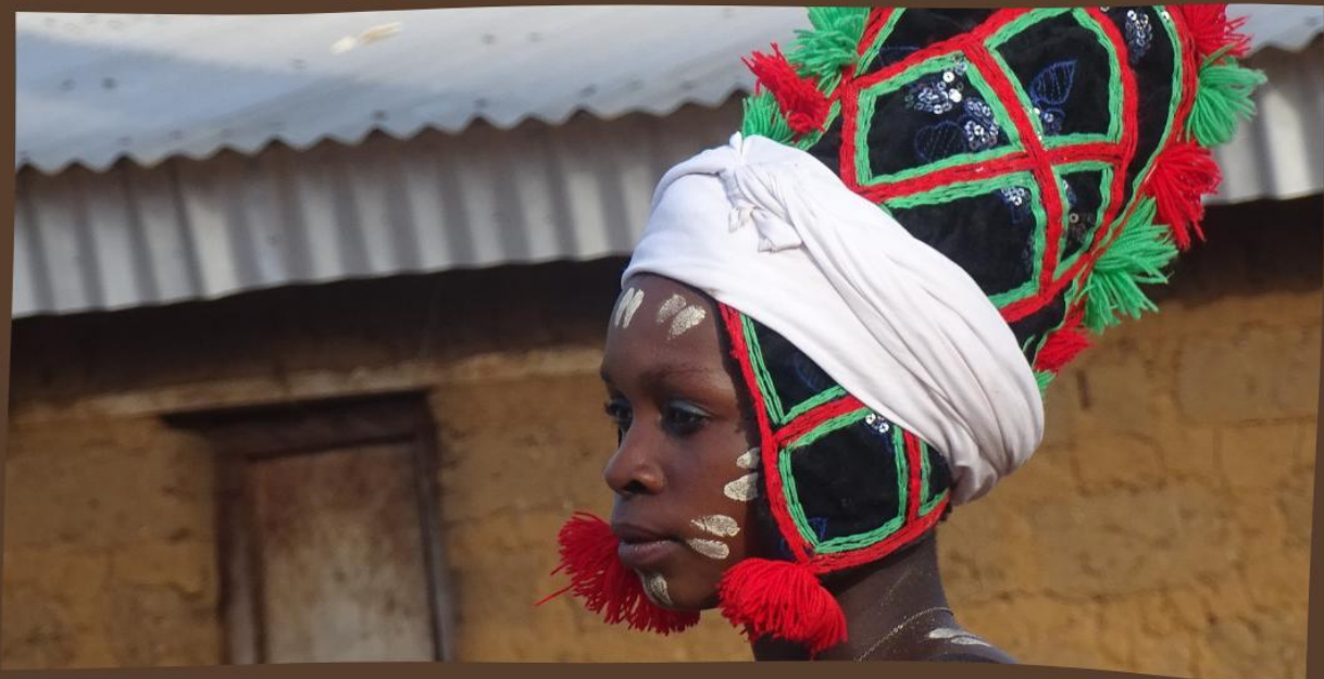
DANZA GUEGBLIN / GUEGBRIN ("de las aves zancudas")