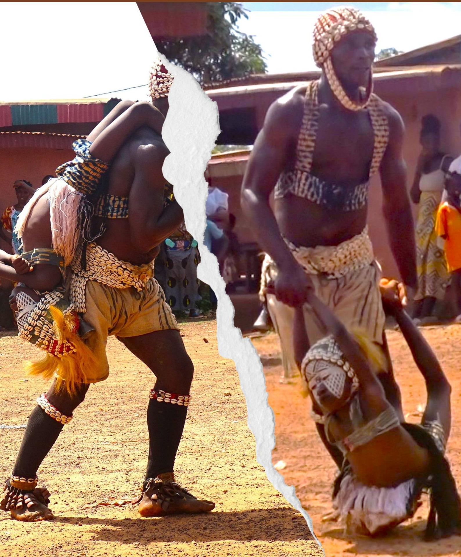
RITUAL DE LAS NIÑAS SERPIENTE