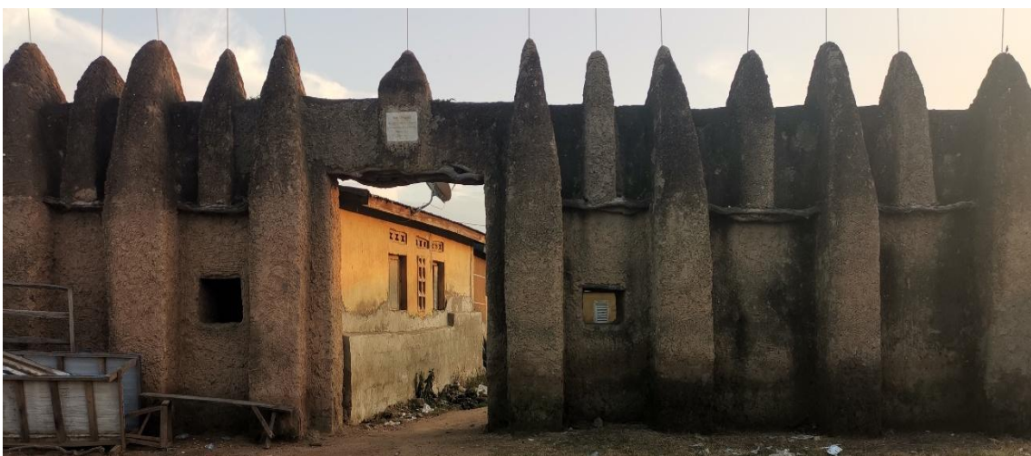
ARQUITECTURA CIVIL EN KONG

Arquitectura monumental: el modelo básico es la gran mezquita de Djenné, cuya forma de construcción ha dado nombre al método Djenné-Ferey que consiste en utilizar ladrillos crudos secos unidos por tierra húmeda, estos forman muros de 40-60 centímetros de espesor, y hasta 20 metros de altura, sobre ellos se disponen elementos decorativos en alto y bajo relieve, y orificios de ventilación para garantizar la circulación del aire en el interior de los edificios.