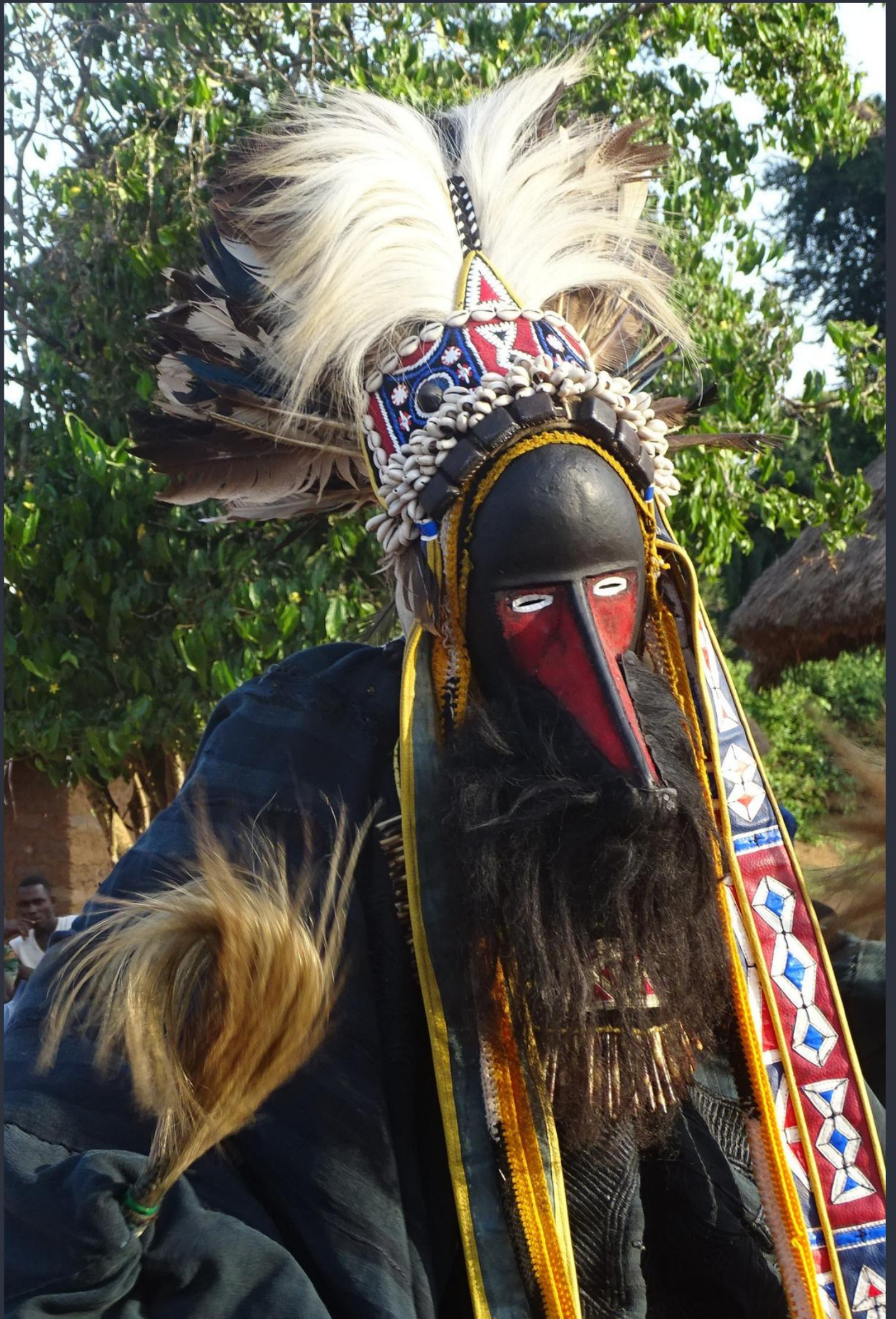
EL CAZADOR-DANZA GUEGBLIN / GUEGBRIN ("de las aves zancudas")