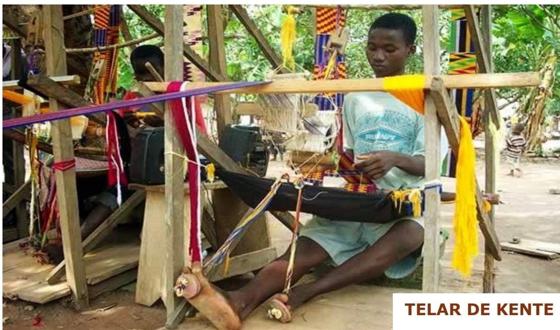
TELAR DE KENTE

Pero, por encima de todo, el campo en el que más destacan es el Textil a mano, usando técnicas tradicionales del siglo X : convierten el algodón crudo en hilos que se blanquean y secan al sol, al cabo de unos días tiñen el hilo con colores extraídos de plantas naturales, estos hilos de colores se colocan en soportes de madera (telares muy largos) para producir tiras estrechas que más tarde se cosen juntas hasta formar una tela completa. Es lo que se llama KENTE* , cuyo origen se encuentra en Ghana y era utilizado por la realeza a modo de toga.