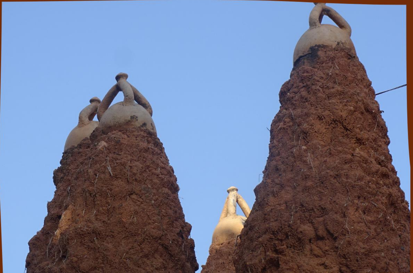
MEZQUITA DE KOUTO