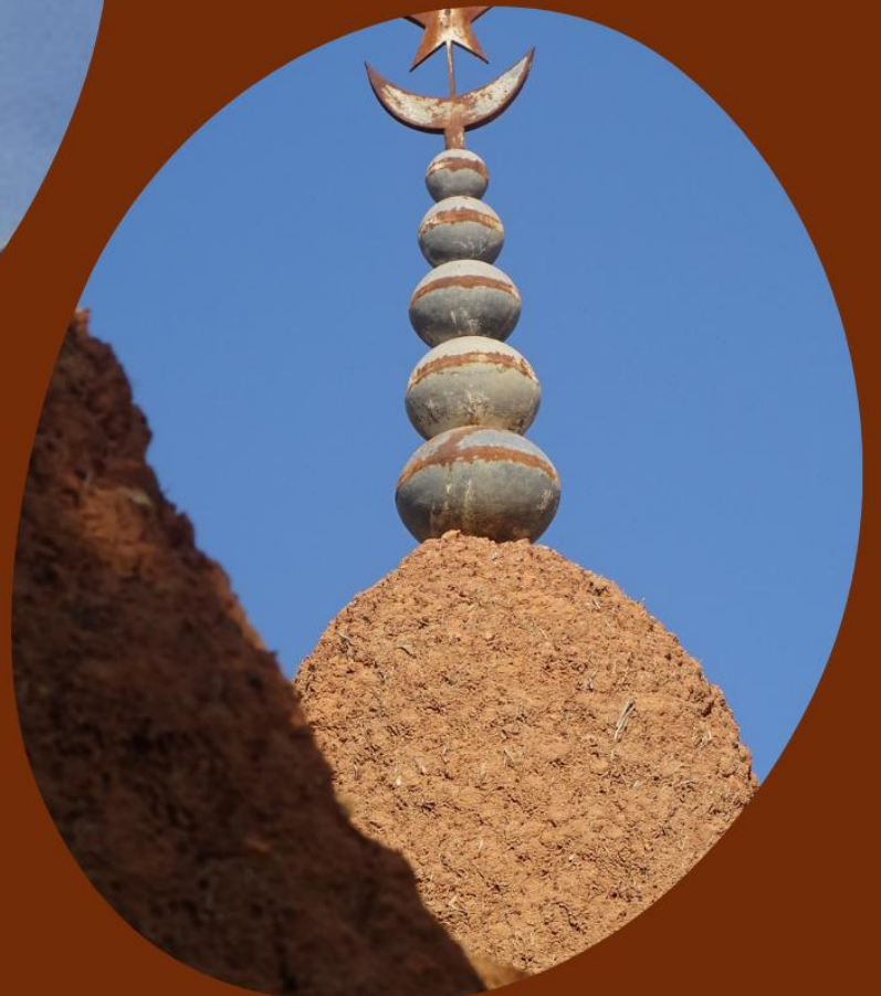
MEZQUITA DE KOUTO